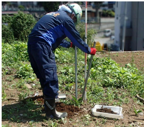
ダブルスコップによる採取