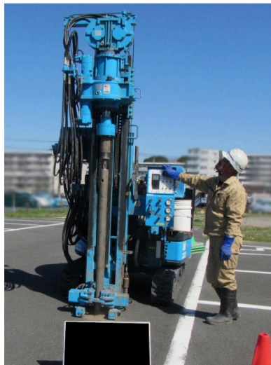
ボーリングマシンによる採取