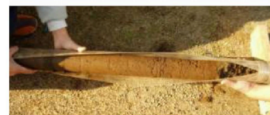
ボーリングマシンで 得られるコア試料